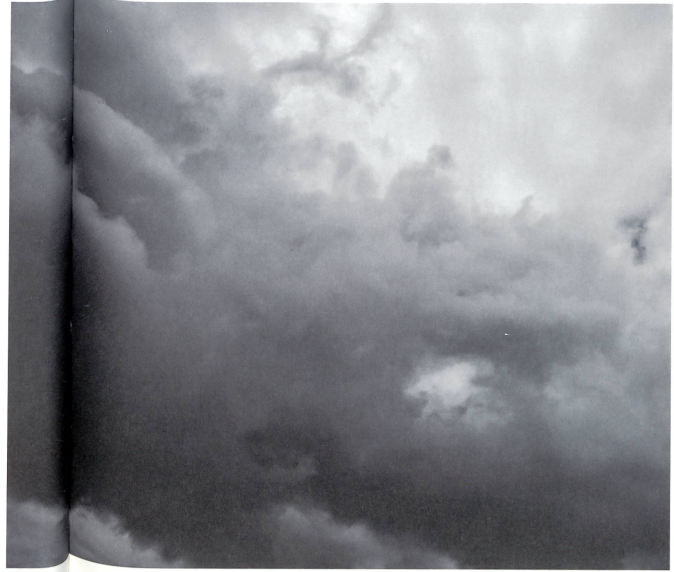
Donovan Wyrsh, Fotograf aus Aarau.