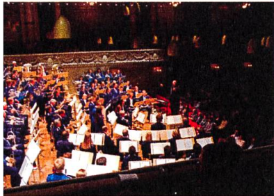
↑ Galakonzert der Stadtmusik Zürich 2004 in der Tonhalle.