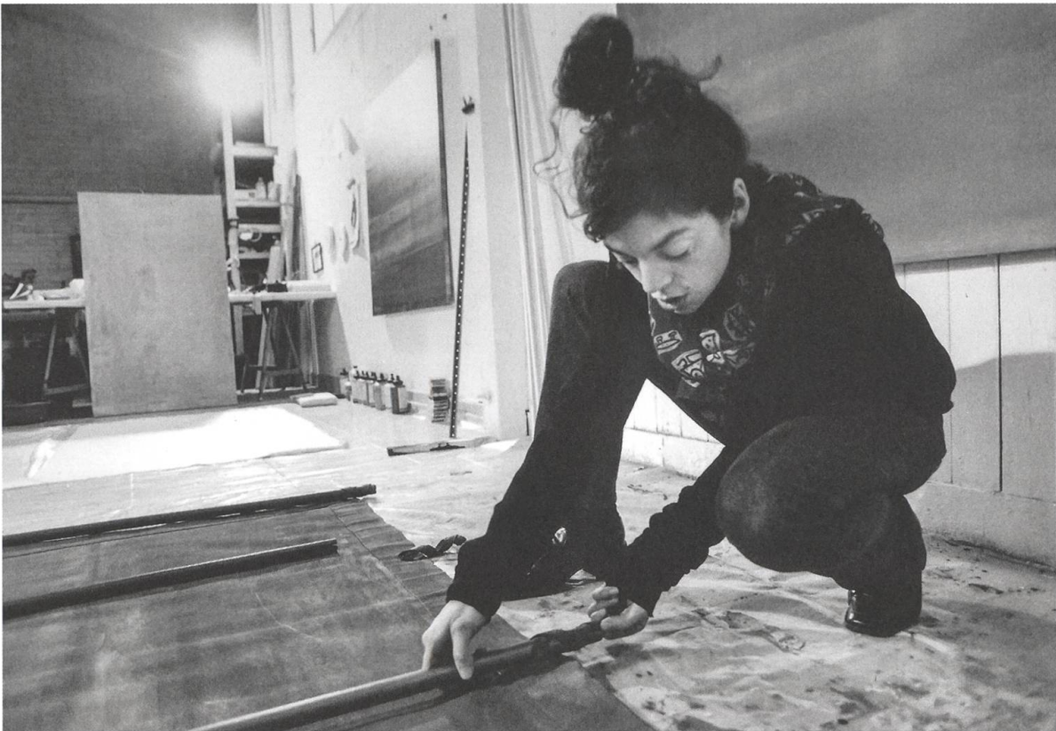
Kunst in Aarau – (fast) frauenfrei