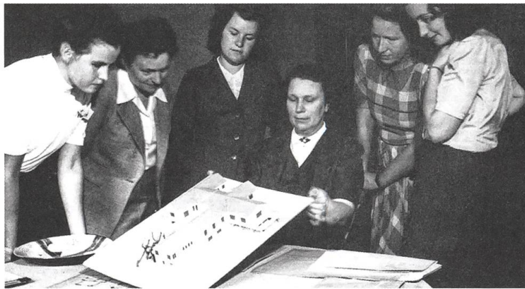
← Lux Guyer in den 1940er-Jahren, Schule für häusliche Arbeit. (Aus: Die Architektin Lux Guyer 1894–1955, hrsg. von der ETH Zürich, Institut für Geschichte und Theorie der Architektur 1983)