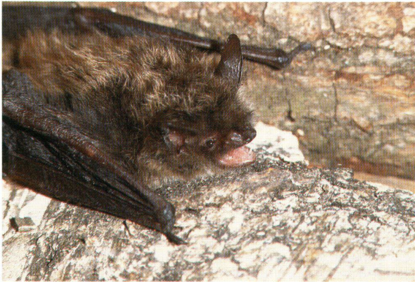
Abb. 13: Brandtfledermaus (Kirchleerau, 9. Aug. 1990)