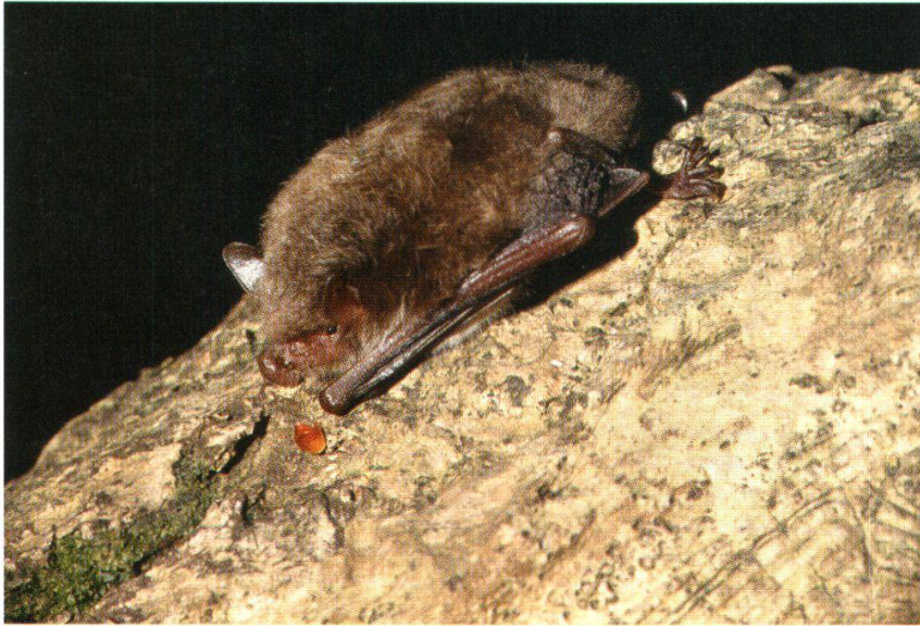
Abb. 18: Wasserfledermaus (Remigen, 9. Mai 1990)