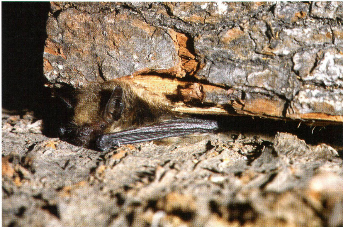
Abb. 12: Kleine Bartfledermaus (Aarau, 2. Sept. 1992)