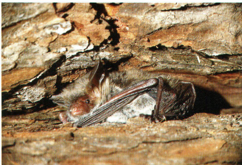
Abb. 15: Bechsteinfledermaus (Remigen, 21. Aug. 1991)