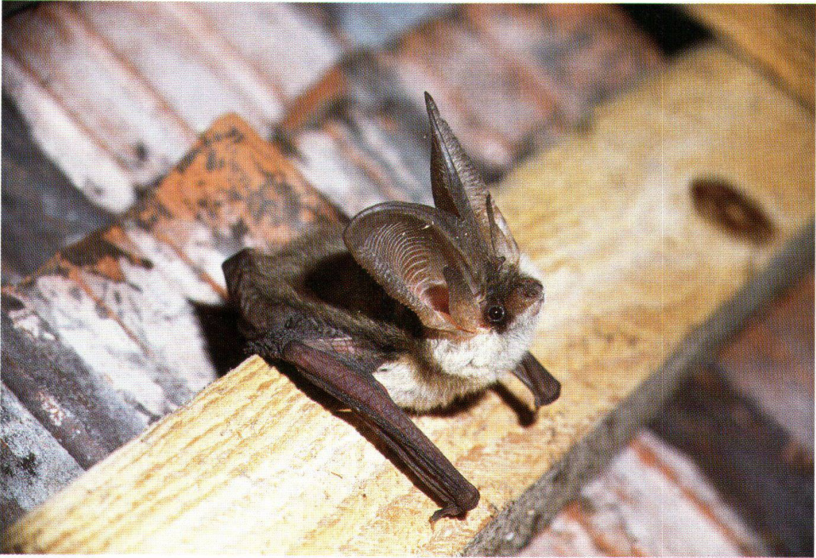
Abb. 27: Graues Langohr (Mandach, 9. Juli 1990)