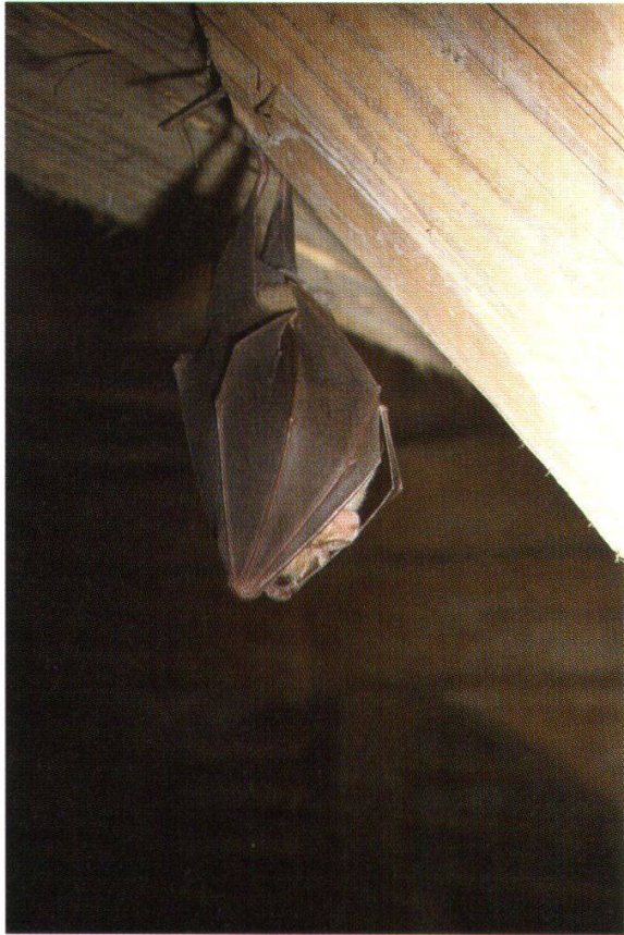
Abb. 10: Grosse Hufeisennase (Jonen, 31. Mai 1986)