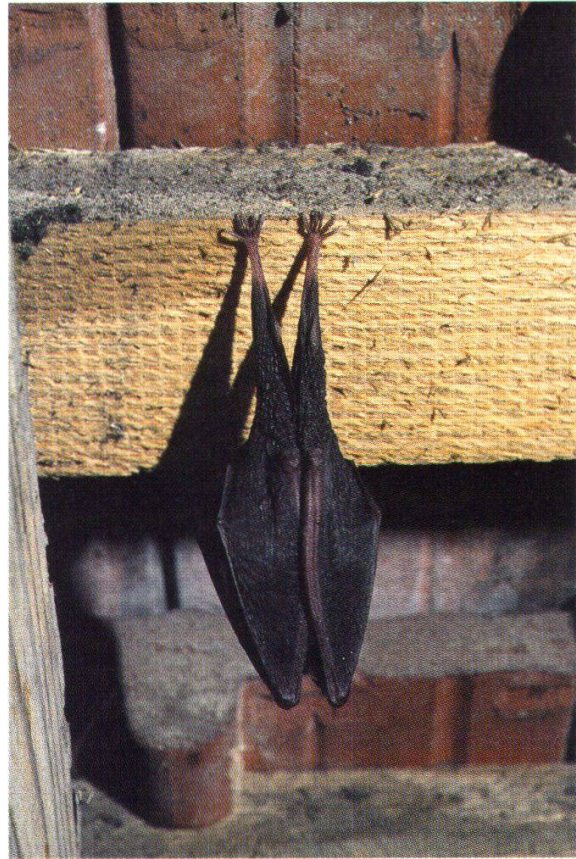
Abb. 11: Kleine Hufeisennase (Sachseln / OW, 27. Mai 1981)