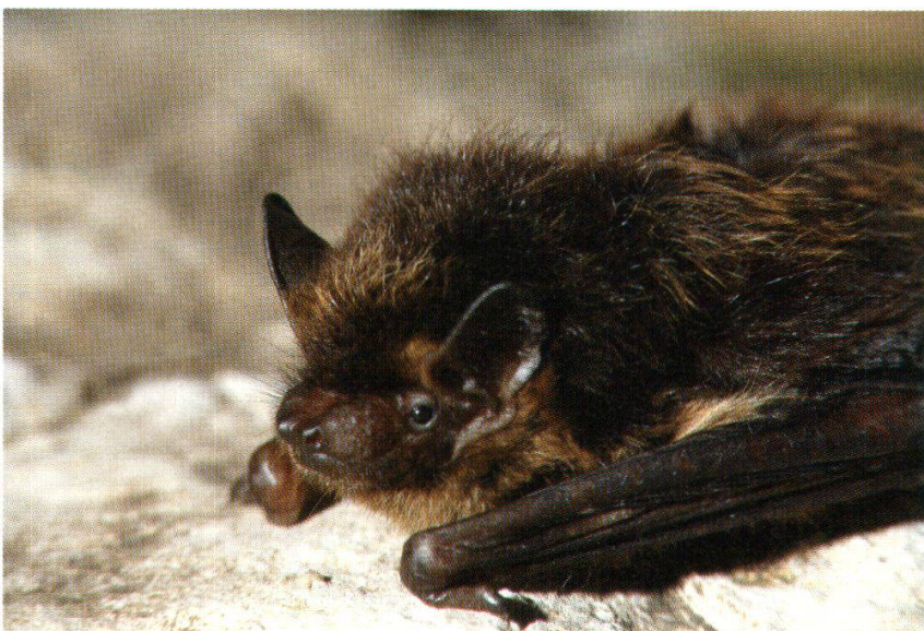
Abb. 26: Nordfledermaus (Engadin, Feb. 1991)