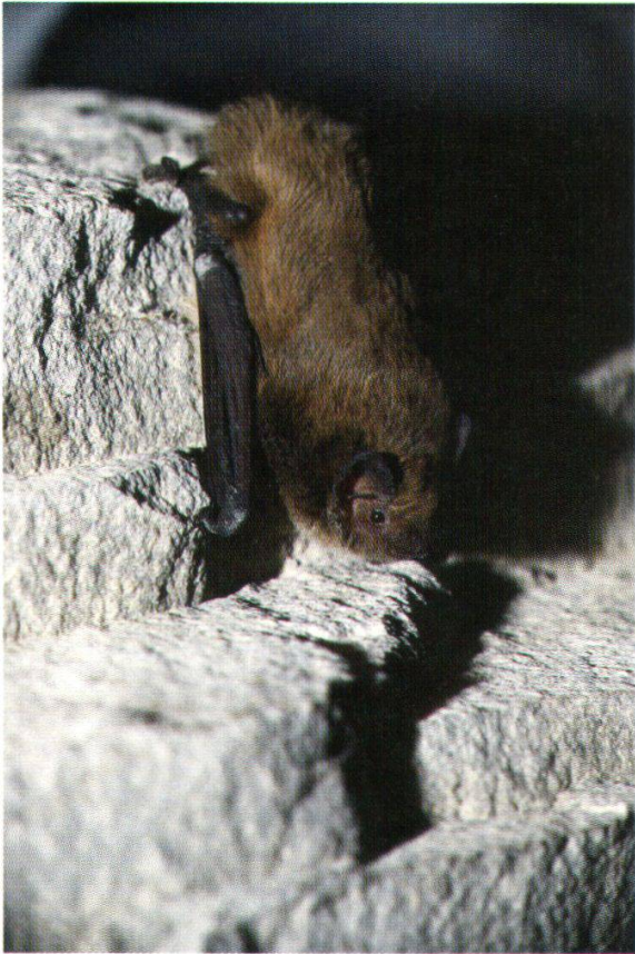
Abb. 21: Weissrandfledermaus (Bremgarten, 26. Sept. 1988)