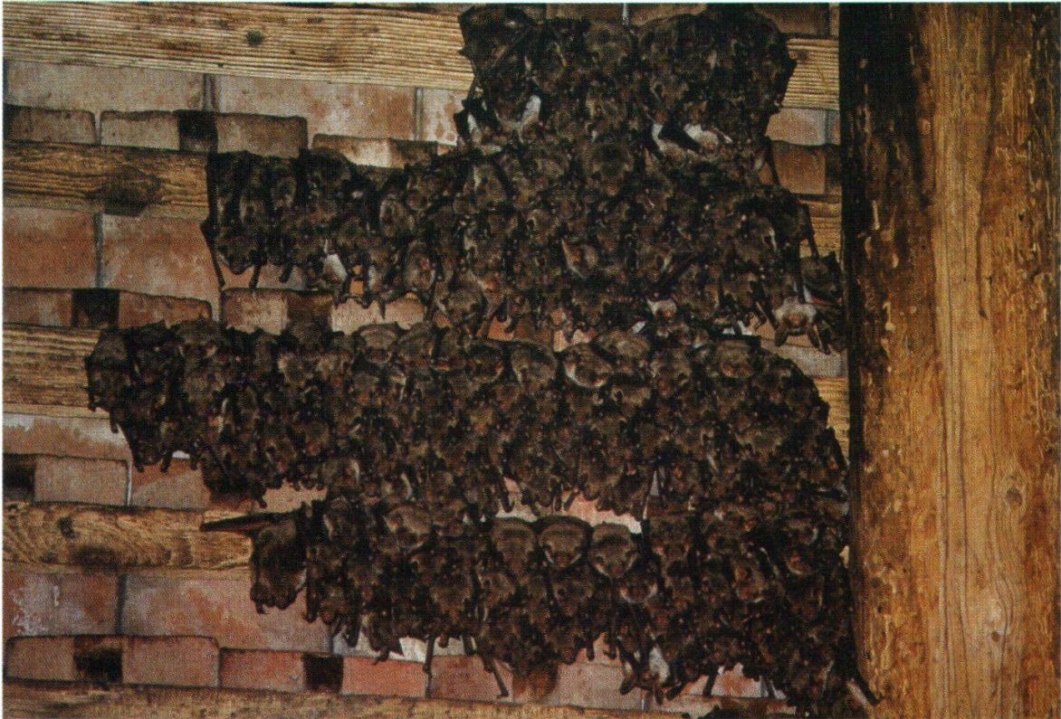
Abb. 16: Grosse Mausohren (Veltheim, 9. Juni 1990)