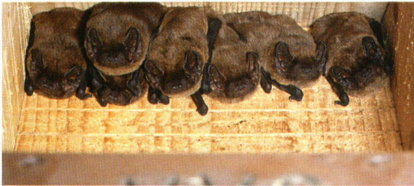
Abb. 19: Kleine Abendsegler (Gränichen, 18. Sept. 1989)