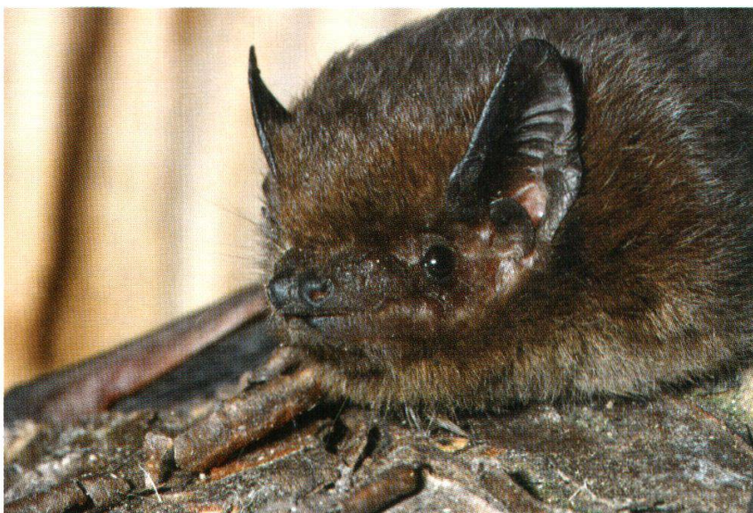
Abb. 20: Rauhhaufledermaus (Rottenschwil, 4. Mai 1986)