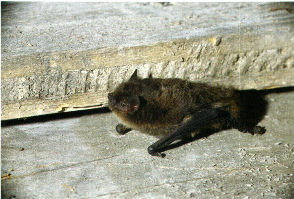
Abb. 17: Zwergfledermaus (Muhen, 15. Jan. 1994)