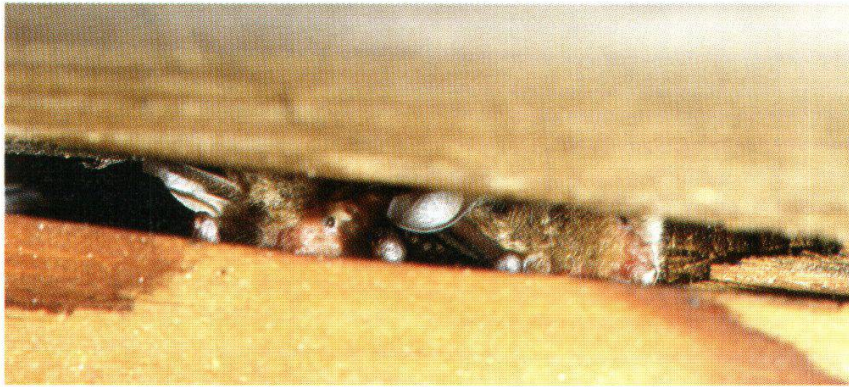
Abb. 14: Fransenfledermäuse (Auw, 30. Juni 1989)