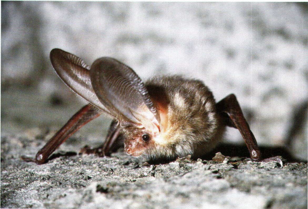
Abb. 28: Braunes Langohr (Jonen, 21. Mai 1986)