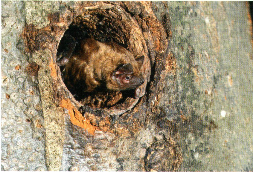
Abb. 24: Grosser Abendsegler (Mülligen, 17. Jan. 1994)