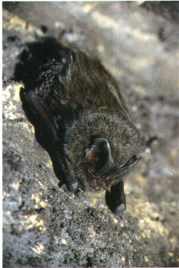
Abb. 22: Mopsfledermaus (Schwaningen / Baden-Württemberg, 3. Feb. 1990)