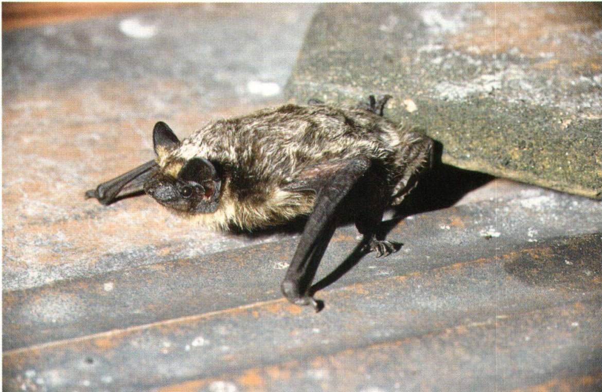
Abb. 23: Zweifarbfledermaus (Oberehrendingen, 12. Juni 1991)