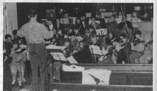
Das Dreiländerensemble probt unter der Leitung von C. Brendel in der Kirche von Munster im Elsass

GENERALDIREKTION, 16, AV. EUGÈNE-PITTARD, 1211 GENÈVE 25, TEL. 022/479222