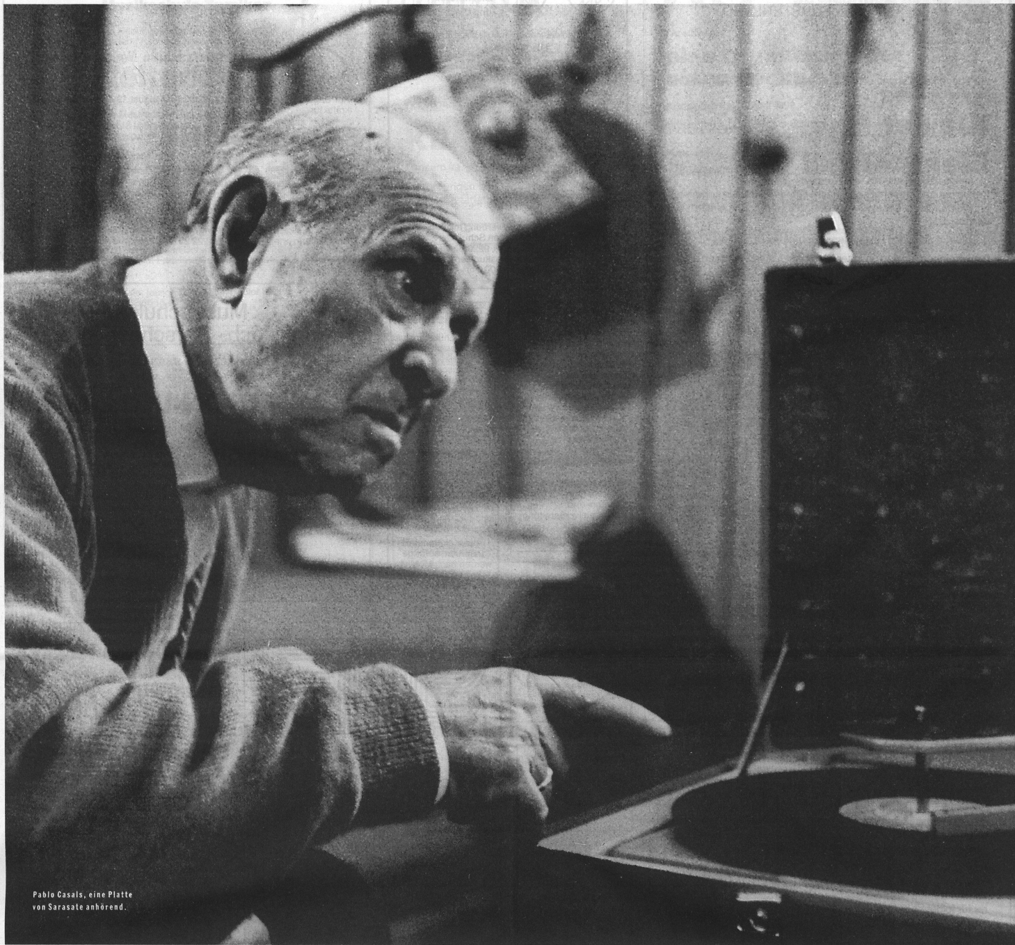
Pablo Casals, eine Platte von Sarasate anhörnd.

Hommage an die Schallplatte: Noch nie zuvor hatte Pablo Casals die Wiedergabe seiner Aufnahmen in so vollendeter Reinheit und Unverfälschtheit vernommen. Wie hätte er auch ahnen können, dass noch im selben Jahrhundert mit der digitalen Aufnahme- und Wiedergabetechnik eine neue Ära eingeläutet werden