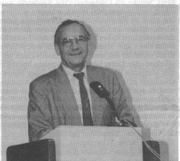
Joseph Frommelt, Präsident der Europäischen Musikschul-Union.

Auch an der diesjährigen Konferenz haben die Delegierten die verschiedenen Länderberichte mit grossem Interesse zur Kenntnis genommen. Besondere Aufmerksamkeit erhielten die Berichte von Kroatien und Litaunien. Die Delegierte aus Kroatien schilderte ein bedrückendes Bild ihrer Musikschulen. Von 54 Schulen wurden 6 während der kriegsrischen Auseinandersetzungen total und zahlreiche Musikschulen teilweise zerstört. Der Schaden und