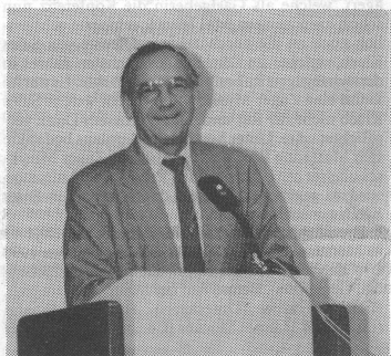
Joseph Frommelt, Präsident der Europäischen Musikschul-Union.

Auch an der diesjährigen Konferenz haben die Delegierten die verschiedenen Länderberichte mit grossem Interesse zur Kenntnis genommen. Besondere Aufmerksamkeit erhielten die Berichte von Kroatien und Litaun. Die Delegierte aus Kroatien schilderte ein bedrückendes Bild ihrer Musikschulen. Von 54 Schulen wurden 6 während der kriegerischen Auseinandersetzungen total und zahlreiche Musikschulen teilweise zerstört. Der Schaden und