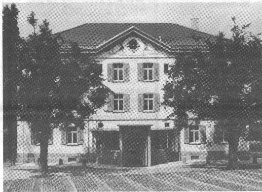
Das umgebaute ehemalige Rorschacher Waisenhaus beherbergt nun die Jugendmusikschule Rorschach-Rorschacherberg.