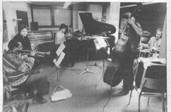
Die Jazzschule St. Gallen feierte ihr zehnjähriges Bestehen. In der allgemeinen Abteilung sind heute 200 Schüler eingeschrieben, die Berufsabteilung zählt 43 Studenten.

Fast gleichzeitig mit der Jazzschule begann die Reihe «Musik in der Klubschule». Anfänglich wurden vorwiegend aus Lehrern gebildete Ad-hoc-Gruppen im Musiksaal der St. Galler Klubschule. Dann entschieden sich die Organisatoren für ein neues Konzept. Es sollten nur noch bestehende Gruppen eingeladen werden, gleichzeitig wurden die musikalischen und geographischen Grenzen geöffnet. In den rund 70 bisher durchgeführten Konzerten gab es sowohl Jazz wie improvisierte und auch ethnische Musik zu hören. Zu den Höhepunkten der ersten Kategorie gehören die verschiedenen Auftritte der welschen BBFC-Musiker oder die zahlreichen Auf Art Lande-Konzerte, in der zweiten sticht die Zusammenarbeit mit Irène Schweizer in unterschiedlichen Besetzungen heraus. Im Bereich Ethno- und Volksmusik sind Flamenco- und Tangokonzerte, ebenso die Auftritte von zwei indischen Gruppen, in diesem Jahr besonders erwähnenswert. Mindestens ein Konzert pro Jahr ist für Gruppen aus dem Welschland reserviert.