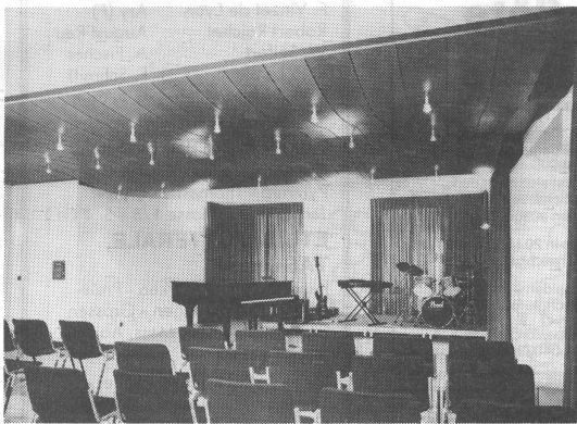
Bei den Umbauarbeiten waren vor allem die Massnahmen für den optimalen Schallschutz und die Raumakustik von Bedeutung.