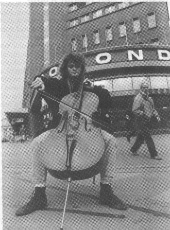
Das Konservatorium Biel - seit ein paar Jahren in der architektonisch bemerkenswerten «Rotonde» domiziliert - feierte sein 60jähriges Bestehen u.a. mit einer 24 Stunden-Non-Stop-Veranstaltung.