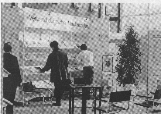
Dans la «Galleria», les écoles de musique allemandes présentent leurs activités. In der «Galleria» informierte der VdM über die Musikschularbeit in Deutschland.

Animato berichtet über das Geschehen in und um Musikschulen. Damit wir möglichst umfassend orientieren können, bitten wir unsere Leser um ihre aktive Mithilfe. Wir sind interessiert an Hinweisen und Mitteilungen aller Art sowie auch an Vorschlägen für musikpädagogische Artikel.