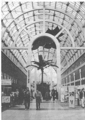
In der «Galleria», dem architektonischen Zentrum der Musikmesse, finden Sonderschauen statt.

Unter den verschiedenen Rahmenprogrammen sind die Vergabe des Frankfurter Musikpreises an den Regisseur Harry Kupfer und die Aktion «Musik Kreativ» des VdM zu erwähnen, welche innovative Ansätze in der Musik, im Instrumentenbau sowie in Komposition und Interpretation fördert. - Die nächste Frankfurter Musikmesse findet vom 16. bis 20. März 1994 statt. RH