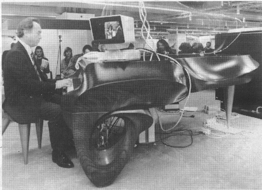
Design particulier pour un piano à queue Yamaha. Designer-Studie für einen Flügel von Yamaha.

Cette année, et ce fut un record mondial, plus de 500 pianos de toutes marques rivalisaient d'originalité et d'élégance. Nous avons ainsi pu faire connaissance d'instruments venus des pays de l'Est dont la facture nous a parfois séduit. Certes, l'Asie reste très présente et offre des produits de très bonne tenue également. Steinway, qui occupait une place stratégique au sein de l'exposition, n'avait jugé bon de ne déplacer qu'un seul instrument. Un geste bien arrogant! Notons également la combinaison de l'électronique aux instruments traditionnels qui permet de transcrire immédiatement sur partition