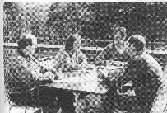
Für die selbständig zu lösenden Gruppenarbeiten suchte man gerne einen attraktiven Platz im Freien.