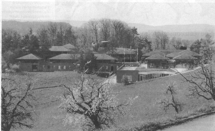
Die evangelische Heimstätte Leuenberg ob Hölstein im Waldenburgerthal (BL) erhielt einen zusätzlichen Anbau (vorne rechts). Der Ort bietet ideale Voraussetzungen zur Durchführung der VMS-Schulleiterkurse.

Die Leitung einer Musikschule ist - bei allen fachlichen und organisatorischen Fähigkeiten, die dafür vorausgesetzt werden - eine Führungsaufgabe mit speziellen Anforderungen. So ist es richtig, dass zwei volle Arbeitstage dieses Basiskurses dem Zürcher Institut für Angewandte Psychologie IAP übertragen wurden. Unter dem Thema «Führung und Arbeitstechnik» waren die Teilnehmer aufgefordert, sich mit führungspsychologischen Grundsätzen auseinanderzusetzen und sich der Herausforderung zu stellen, Führung als Rolle zu übernehmen, in der Persönlichkeit und ständig