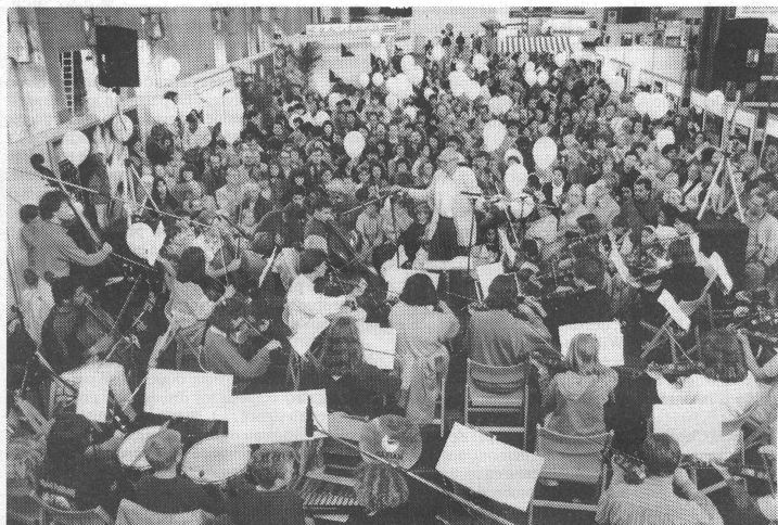
Wegen schlechten Wetters spielte die Jugendmusikschule Zürich ihr Open-Air-Konzert zum Abschluss des Schuljahres nicht im neu hergerichteten Parkareal «Platzspitz», sondern in der Halle des Zürcher Hauptbahnhofes. Die rund 180 Jugendlichen musizierten während fast dreier Stunden mit Enthusiasmus und grossem Erfolg. Die überaus zahlreiche Zuhörerschaft setzte sich vor allem aus Eltern und Geschwistern der jugendlichen Musikanten sowie zufällig anwesenden Passanten und Reisenden zusammen. (Ausführlicher Bericht auf Seite 11.)