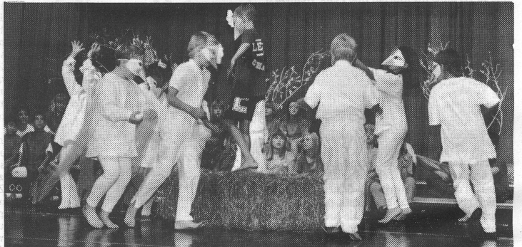
Unsere Aufnahme zeigt Szenenausschnitte aus der Aufführung des «Karneval der Tiere» durch Schüler der Liechtensteinischen Musikschule an der IMTA 93. Die Leitung oblag Musikdirektor Josef Frommelt , der auch im Organisationskomitee der Internationalen Musischen Tagung dafür sorgte, dass dem Bereich Musik die ihr gebührende Bedeutung beigegeben wurde.