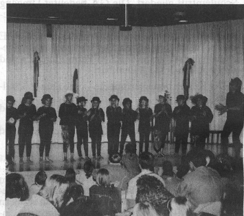
Auch die Musikalische Grundschule trug - hier mit einem lustigen Tanz - zum bunten Angebot der Festdarbietungen bei.

te am Samstagnachmittag in Moosseedorf ein reichhaltiges Festprogramm beginnen. Im Kirchgemeindehaus, in der Kirche und im alten Schulhaus wurden von den Schülern musikalische Leckerbissen präsentiert, während auf dem Vorplatz die Risottoküche fürs leibliche Wohl sorgte. Für grosse und kleine Kinder gab es ein Musikquiz, eine Klangwerkstatt, Schminken, Glücksfischen und vieles mehr. Abgeschlossen wurde der fröhliche Nachmittag mit der Aufführung des musikalischen Märchens Pezzettino.