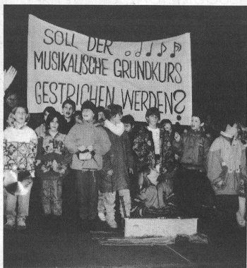
Am 8. Dezember 1993 wurde in Basel eine Petition mit 17 789 Unterschriften eingereicht, welche die Weiterführung des 4. Grundkursjahres an den Primarschulen von Basel fordert.

Wenn man bedenkt, dass der Anteil der Ausländerkinder in der Primarschule von Basel rund 35 Prozent beträgt, wird die soziale und integrierende Funktion des gemeinsamen Musizierens besonders