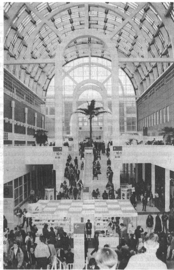
Eine Oase im Messetreiben: die «Galleria» mit der Sonderschau «Digital Audio» und Informationsständen der Musikschulen und der Bühne «Musikmesse in Concert».

Im Vergleich mit den übrigen Ausstellungs hallen bietet jene der Verlage geradezu Erholung für die Ohren; grundsätzlich kann gesagt werden: je mehr Elektronik, um so höher der Geräuschpegel. Vor allem auf den drei Ebenen der Halle 9 wurden nicht nur die feineren Ohren malträtiert. Der Informationsstand der Universität Giessen bildete wirklich einen kleinen Kontrapunkt zum Messelärm. Hier konnte man sich einem Gehör-