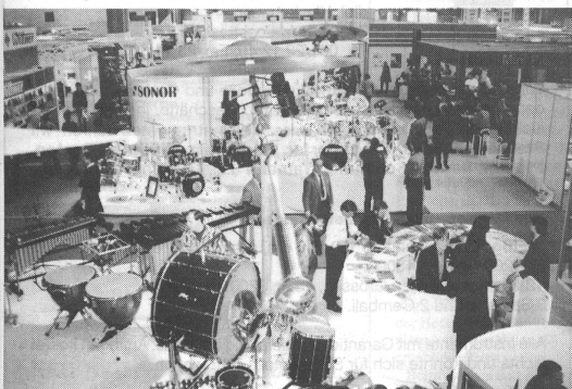
Auf mehr als 80 000 Quadratmetern Ausstellungsfläche präsentiert an der Frankfurter Musikmesse über 1 253 Firmen aus aller Welt das grösste Angebot an Musikinstrumenten, Noten, Musikzubehör, Licht- und Tontechnik.