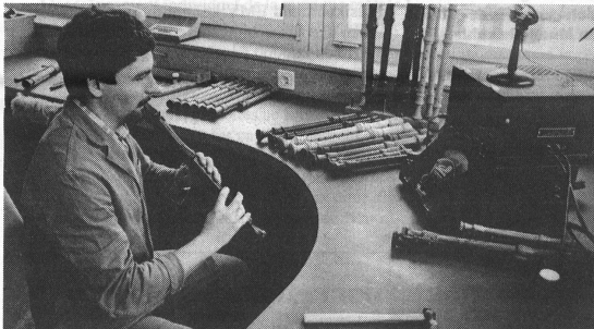
Jede einzelne Blockflöte wird sorgfältig kontrolliert und eingestimmt. Nur was das Gefallen der Flötenbauer findet, darf die Werkstatt verlassen.

Heute ist Kung die einzige Firma in der Schweiz- und auch weltweit eine der wenigen Werkstätten - welche die vollständige Blockflötensfamilie herstellt, nämlich Garklein, Sopranino, Sopran, Alt, Tenor, Bass, Grossbass und Subbass; insgesamt ein Tonum- fang von mehr als fünf Oktaven, nämlich vom F bis zum a 4 . Der Name Kung ist in vielen Teilen der Welt ein Synonym für hochstehende Instrumentenbau- kunst geworden. Dies wurde nicht zuletzt auch an den gediegenen Jubiläumsveranstaltungen zum 60jährigen Bestehen der Firma deutlich: Die Eglise Réformée Française in Zürich konnte die überaus zahlreiche Besucherschar des Jubiläumskonzertes mit dem Amsterdamer «Loeki Stardust Quartet» kaum fassen, und auch das eigentliche «Geburts- tagsfest» im Casino Schaffhausen mit «Musik vom Mittel- bis zum Nattel-Alter» sowie populärer «Stubete» lockte einen illustren Kreis von Block- flötensliebhabern an. Richard Hafner