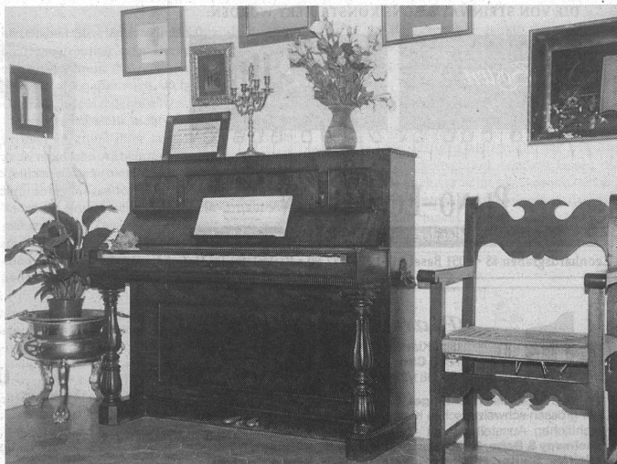
«Bitte nicht berühren»: Das mallorquinische Klavier, das Chopin den «Pleyel» ersetzen musste – heute in Valdemossa eine unantastbare «Reliquie».

Der Mietwagen des Landes ist die «tartana», eine Art Krenser ohne jede Federung, von einem Pferd oder Maultier gezogen. Der Kutscher singt die ganze Zeit hindurch und unterbricht nur, um gelassen die grässlichsten Flüche auszustossen, wenn sein Pferd zögert,