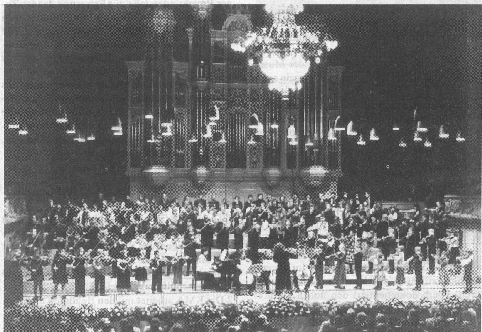
Grosses «Fiddlefest» mit 80 geigenden Kindern aus Harlem und Zürich und einigen Starsolisten in der Zürcher Tonhalle.

fen, gleichzeitig mit der Film Premiere eine Reprise des New Yorker Konzertes unter Mitwirkung von Zürcher Musikschülern in der Tonhalle zu veranstalten. Wiederum mit von der Partie waren Isaac Stern und Arnold Steinhardt. Nebst weiterer internationaler Podiums Prominenz konnten diesmal für die Mitwirkung in Bachs Doppelkonzert u.a. auch die Konzertmeister des Tonhalleorchesters, des Orchesters der Oper Zürich und des Winterthurer Stadtorchesters gewonnen werden.