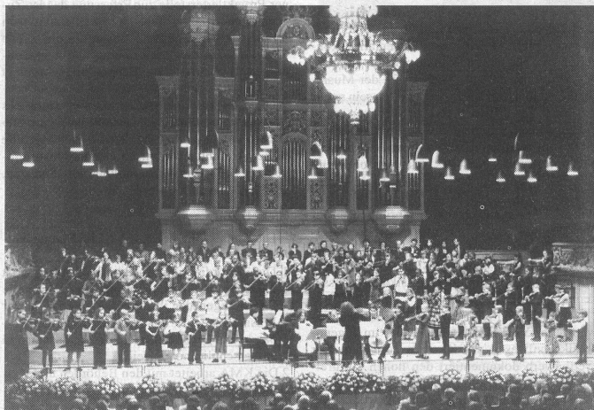
Grosses «Fiddlefest» mit 80 geigenden Kindern aus Harlem und Zürich und einigen Starsolisten in der Zürcher Tonhalle.

fen, gleichzeitig mit der Film Premiere eine Reprise des New Yorker Konzertes unter Mitwirkung von Zürcher Musikschülern in der Tonhalle zu veranstalten. Wiederum mit von der Partie waren Isaac Stern und Arnold Steinhardt. Nebst weiterer internationaler Podiums Prominenz konnten diesmal für die Mitwirkung in Bachs Doppelkonzert u.a. auch die Konzertmeister des Tonhalleorchesters, des Orchesters der Oper Zürich und des Winterthurer Stadtorchesters gewonnen werden.