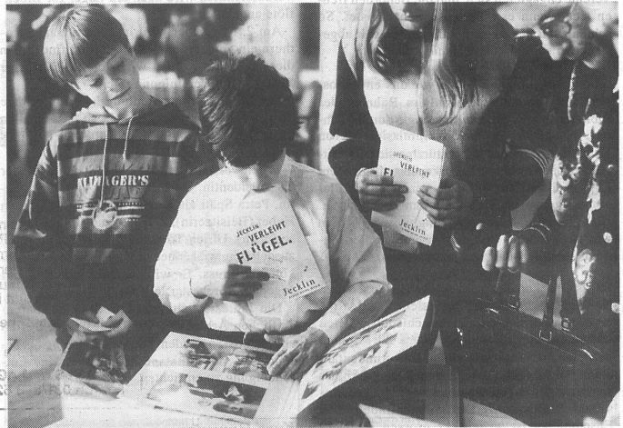
Was bleibt: Gute Erinnerungen an ein starkes Erlebnis und sprechende Bilder von Alberto Venzago.