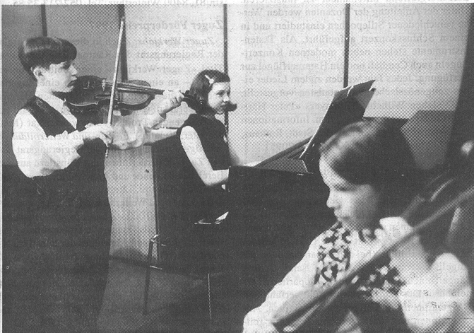
Vor dem grossen Auftritt: Einspielen im stillen Kämmerlein.