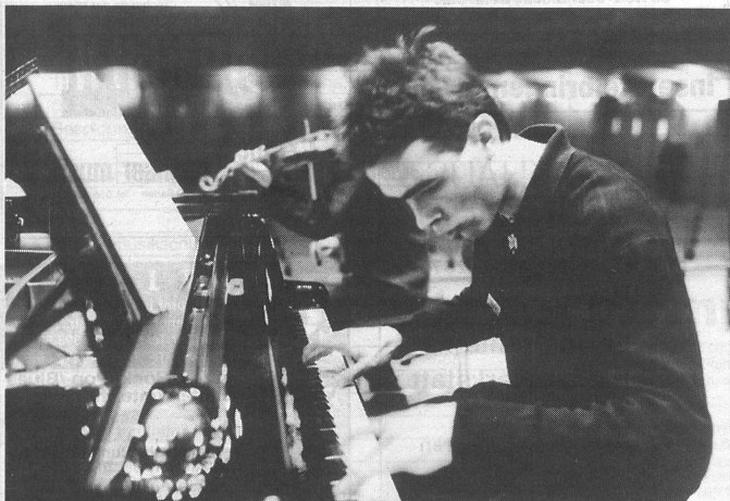
Der grosse Augenblick: Mit höchster Konzentration in die Tasten und Saiten gegriffen.