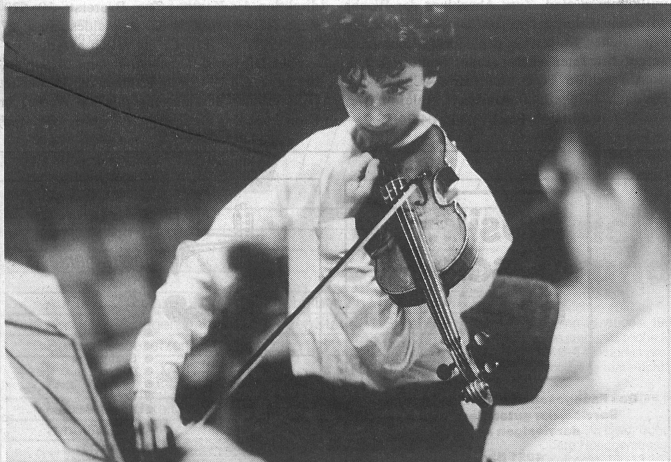
Auf dem Podium: Auf die gute Stimmung kommt es an.