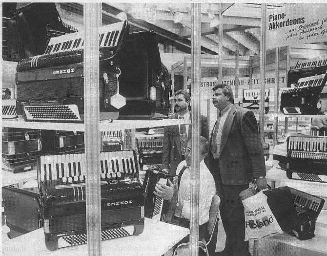
Ganz nach Belieben: einfach nur bestaunen, vorführen lassen oder selber ausprobieren.