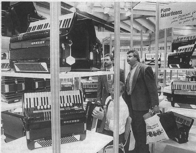
Ganz nach Belieben: einfach nur bestaunen, vorführen lassen oder selber ausprobieren.