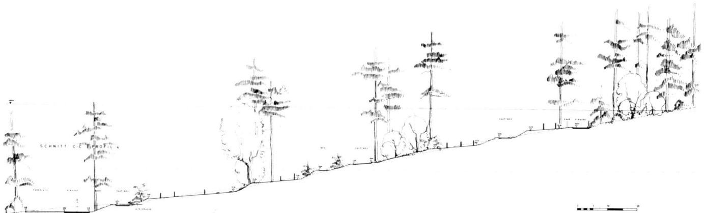
Friedhof Untersiggenthal: Schnitt C-C auf dem Grundriss-Plan.