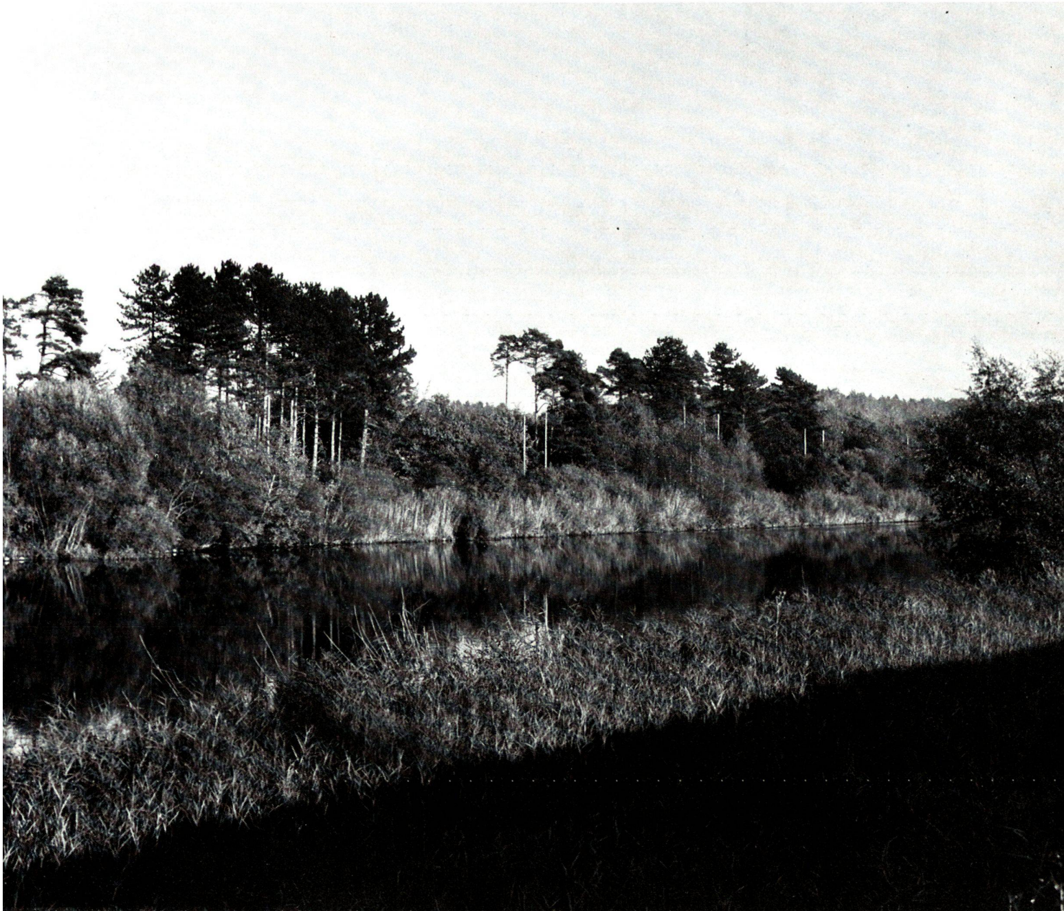
Am Aare—Hagneckkanal. Hier hat der künstliche Wasserlauf dank einem reichen und gemischten Gehölzbestand einen nahezu natürlichen Charakter erhalten.

The first correction of the Jura waters created, besides the cultivated land, a unique recreational landscape with large and small canals for pleasure craft.