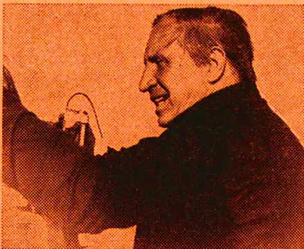
Prof. Dr. Roland Rainer

Zum neuen China-Buch von Roland Rainer bereits in seinem 1972 erschienenen Buch über «Lebensgerechte Aussenräume» (Artemis-Verlag, Zürich) hat sich Roland Rainer als Befürworter eines sich weitgehend auf östliche Vorbilder berufenden städtebaulichen Konzepts vorgestellt. Dem von Gebäuden umschlossenen Grünraum misst er dabei grösste Bedeutung zu.