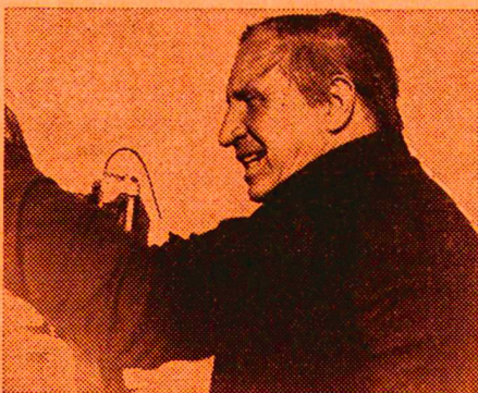
Prof. Dr. Roland Rainer

Zum neuen China-Buch von Roland Rainer Bereits in seinem 1972 erschienenen Buch über «Lebensgerechte Aussenräume» (Artemis-Verlag, Zürich) hat sich Roland Rainer als Befürworter eines sich weitgehend auf östliche Vorbilder berufenden städtebaulichen Konzepts vorgestellt. Dem von Gebäuden umschlossenen Grünraum misst er dabei grösste Bedeutung zu.