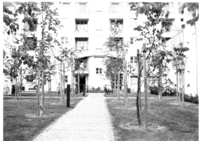
Links: Ein kleiner Hof (Luisenstadt) – zu sehr durchgestaltet?