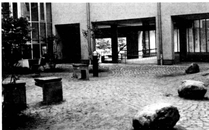
Links: Sprachlos – neuer Hof in der Kochstrasse/südl. Friedrichstadt.

Only in a few cases has there been any success in developing a language of form for the open spaces which does not just refer formally to the constructed architecture. Some doubt must