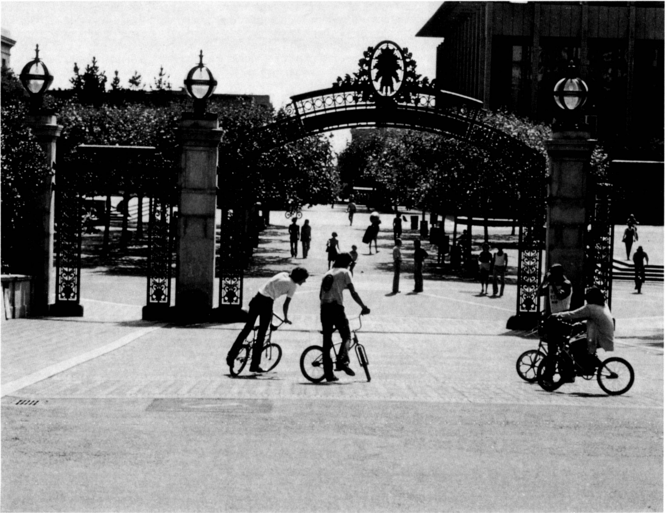
Eingang zur Berkeley-Universität.