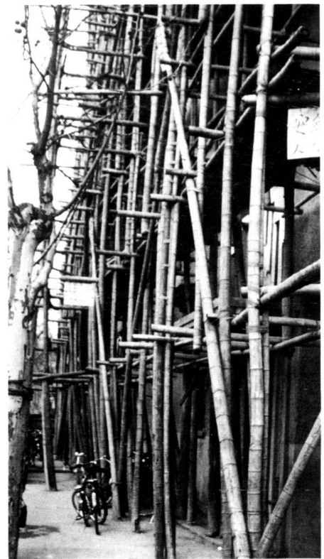
Gerüst an einem Gebäude, Shanghai, China.

What the latest research is "discovering" would seem to be something that the Chinese have already known for a long time: Chinese bridges, for instance, which are suspended from cables made of twisted bamboo, are the forerunners of our suspension bridges. The superb bridge across the Min River in Sichuan (China) is suspended from bamboo cables of some 20 cm in diameter. They are tightened like oversize guitar strings. The Min Bridge is still in use today after over 1000 years. It is regarded as one of the world wonders of early engineering.