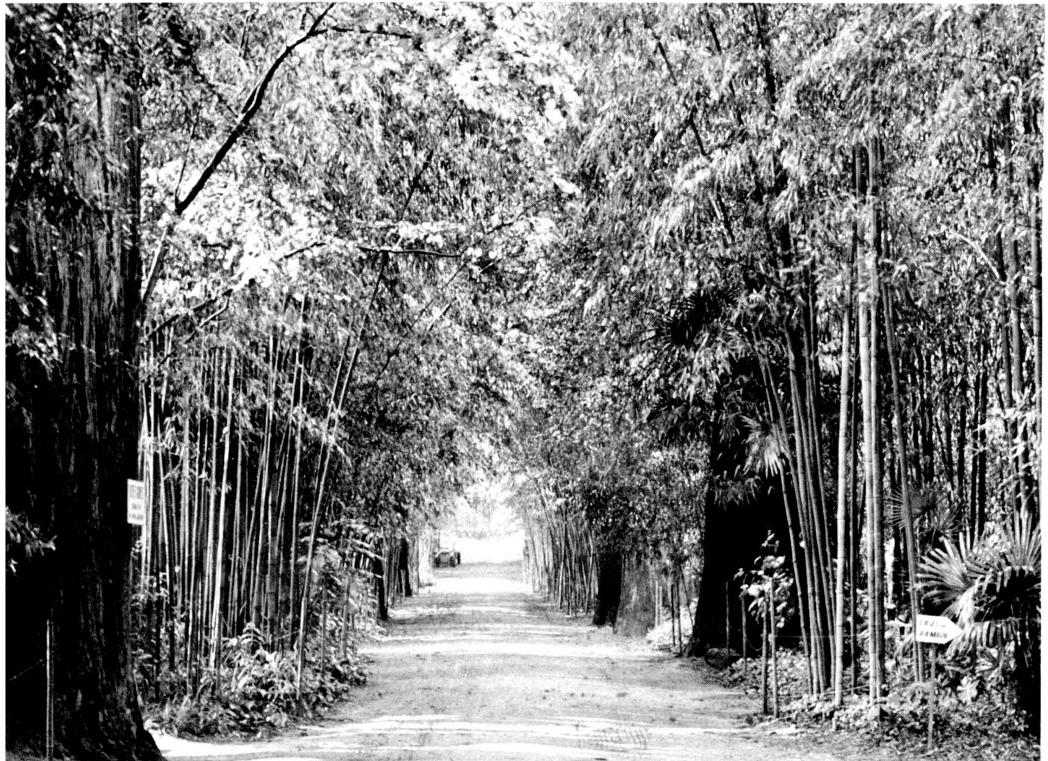
The bamboo avenue at Prafrance.