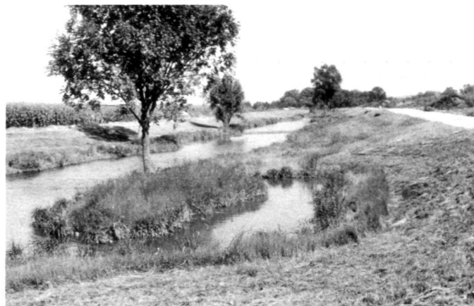
Left: Fig. 6: The badly damaged flood channel of the Vils, 1986.

Rechts: Abb. 7: Flutkanal der Vils 1988. Durch zusätzlichen Grunderwerb konnten die Sohle umgestaltet, die Ufer abgeflacht und damit Voraussetzungen für eine naturnähere Entwicklung eingeleitet werden.