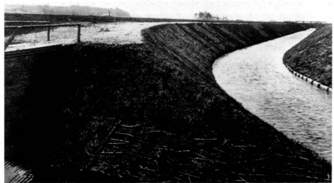
A gauche: Fig. 2: Cours de la rivière avant les travaux de régularisation effectués dans la prairie qu'elle inondait.

Rechts: Abb. 3: Nach der Regulierung. Eine Renaturierung mit Anhebung der Gewässersohle ist ohne Nutzungseinschränkungen in der Aue nicht möglich.