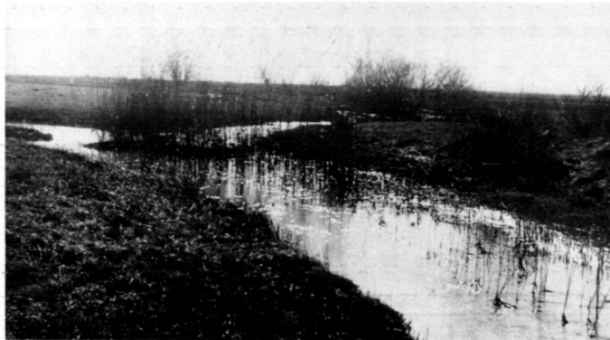
Links: Abb. 2: Bachlauf vor der Regulierung in verästelter Aue.

The incorporation of training walls, groynes and invert ramps, the provision of islands, zones of shallow water and old branches, and careful attention to the flora, the water plants, riverside bushes and reeds, as well as the thickets, enrich the features of the habitat in the water and in the water transition zone. The provision of biotope