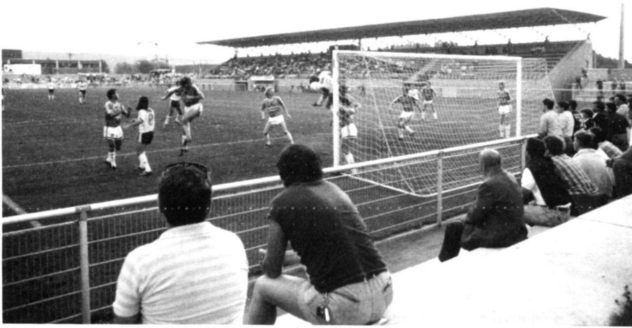
Links: Blick ins Stadion des FC Baden.