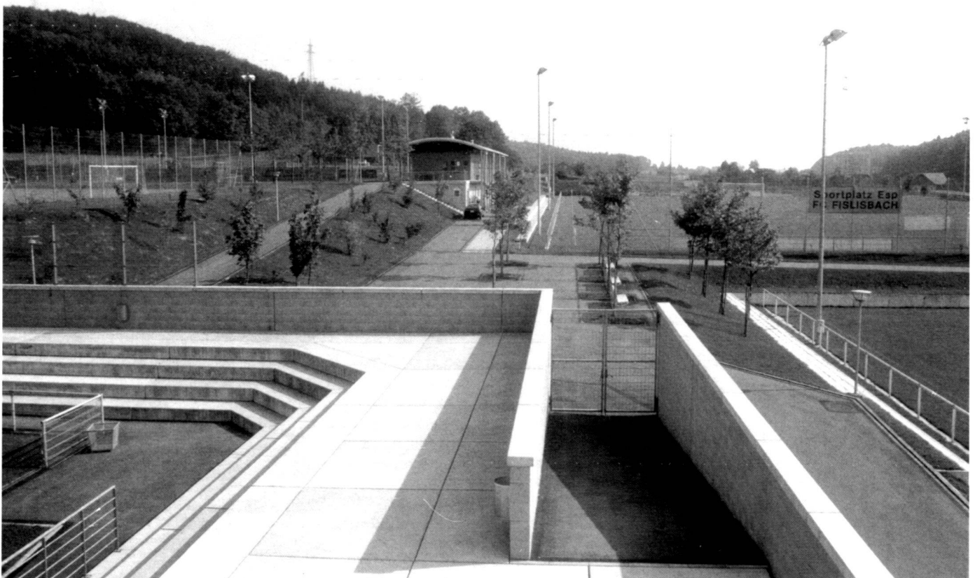
Blick vom Stadion gegen das Garderobengebäude des FC/TC Fislisbach.

The grounds were cleared for playing in stages, the last part being the stadium in June 1988. The various parts of the complex have proved themselves well up to now. In particular, the special atmosphere in the stadium, located between the forest, retaining walls and buildings, is singled out for praise. Of particular interest is the possibility of comparing the various surfacing systems. It has been possible to maintain the "intergreen" grounds without any problems up to now – albeit with much lower utilisation. There were initial teething problems with the lava surfaces. These are considerably "heavier" in going in the early stages and have to be played in with care. The sterile substratum does not only display advantages. It will only be possible to draw final conclusions in a few years time when comparable figures with respect to wear and maintenance will be available.