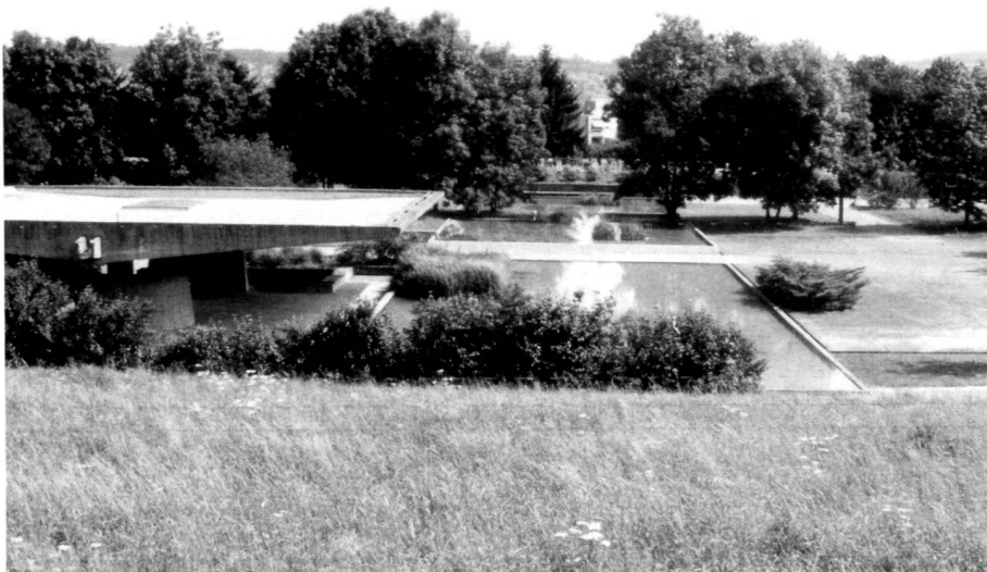
Abb. 3: Friedhof Eichbühl, Zürich, von Fred Eicher und Ernst Studer (Bauten). Ill. 3: Cimetière d'Eichbühl, Zurich, par Fred Eicher et Ernst Studer (bâtiments).

Since the eighties, prize-winning competition entries and the projects constructed have been signalling slight changes in the design of cemeteries which are, admittedly, also to be seen in other sectors of garden architecture. It is no longer general design hints or ideal types which are in demand, but giving more attention to the place has taken on the greatest importance. The cemetery is recognisable as such again, it no longer ducks unobtrusively, does not hide behind thickets and hedgerows, but shows itself self-assuredly at an excellent point, standing out clearly against the adjoining countryside or residential area. Preference is given to extending existing cemeteries – even if the land available is in short supply – rather than building