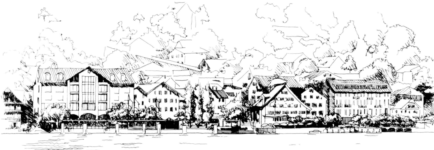
Sicht vom Vierwaldstättersee auf das neugestaltete Seeufer von Beckenried. Bepflanzung, Sitzstufen und Pergolen setzen neue Akzente.