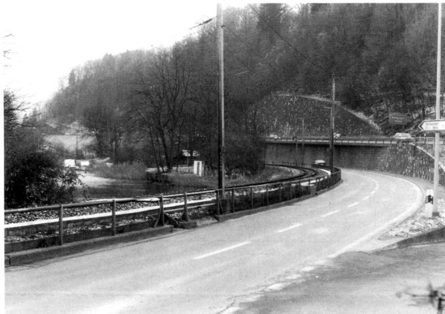
Abb. 3. Bestehende Situation bei Ennethorw, rechts oben Autobahntrasse.