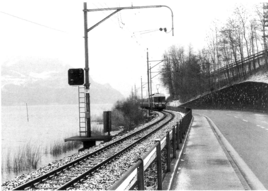
Abb. 2. Bestehende Situation Richtung Hergiswil, rechts oben Autobahntrasse.