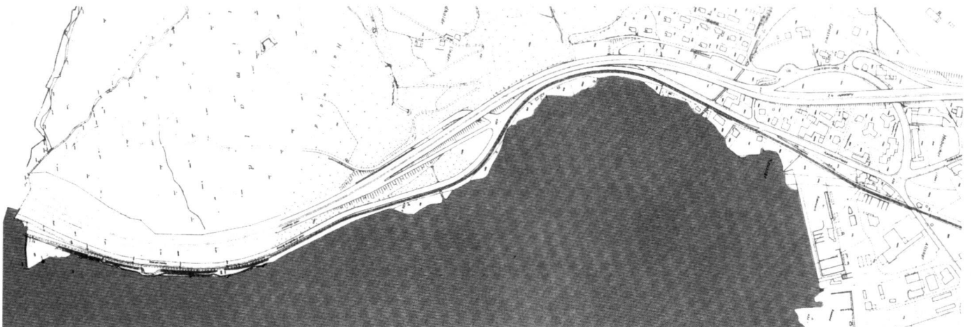
Abb. 1. Bestehende Situation im Seebereich zwischen Ennethorw und Hergiswil.

The starting point for planning was an already existing improvement project dating from 1982. This envisaged routing the cantonal road, SBB double