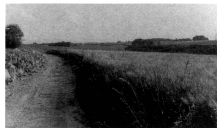
Dans les champs, entre site et forêt. In den Feldern, zwischen Gelände und Wald. In the meadows between the site and the forest.

The site, the landscape dropping towards Bussigny and the Lake Geneva basin.