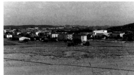
Du site, le paysage bascule sur Bussigny et le bassin lémanique.

This domed site on a projection from the plateau into the valley of the Venoge has been occupied by various undertakings over the past years who have made their mark on it: a slightly inclined plane of a surface of deposits, excavations, backfill, a precipitation tanks installation, silos, ditches... the result is an artificial and complex microtopography. The chances to be taken reveal themselves: on the horizon of the inclined plane are the Alps; at the watershed, the landscape dips down towards Bussigny; one of the holes constitutes an open space isolated from the place, a crater open to the sky; large embankments from the other hole open onto the rural countryside, while fitting in with a nearby hill; an embankment itself marks