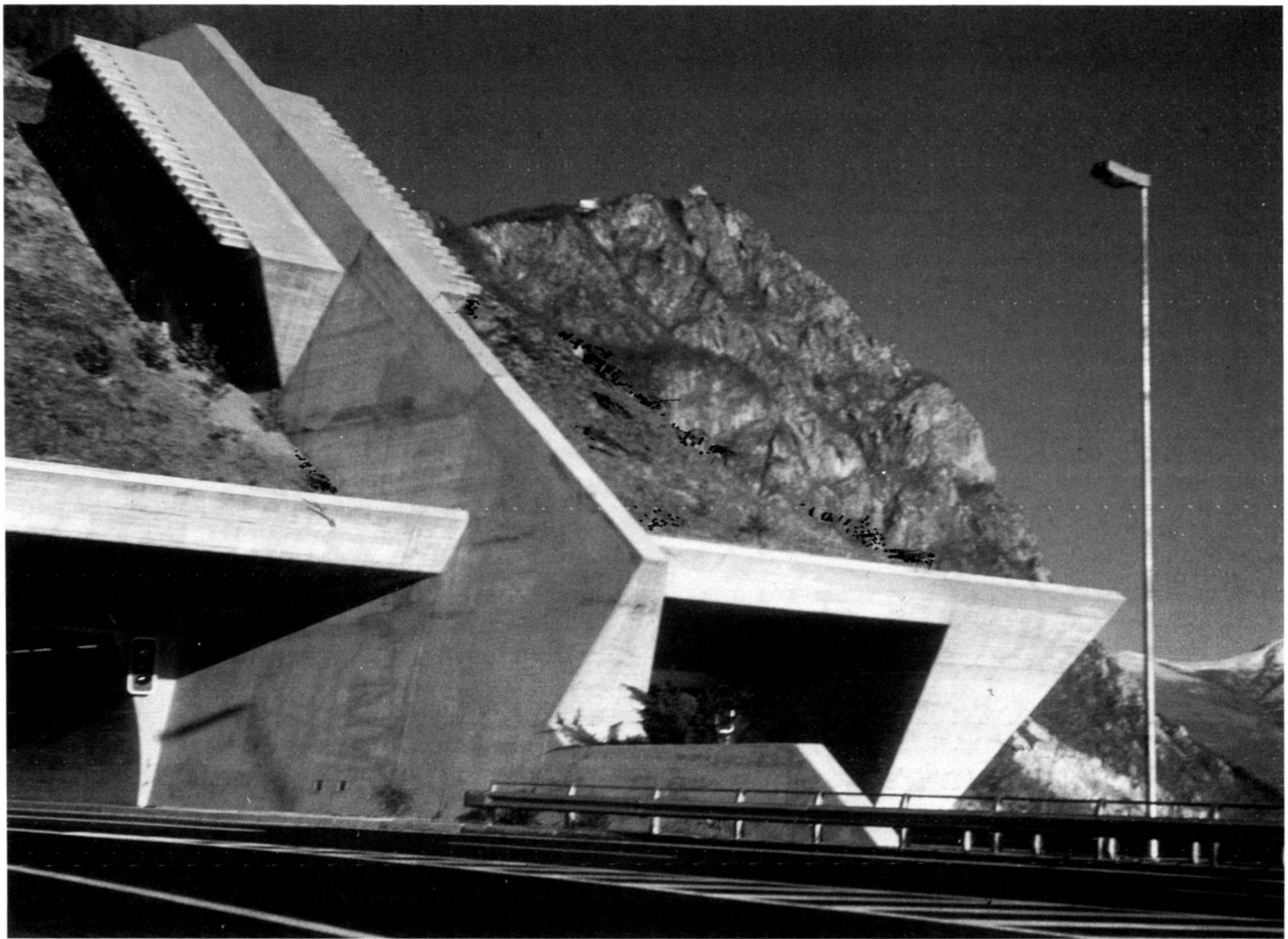
Galleria autostradale a Melide. Arch. FAS Rino Tami.