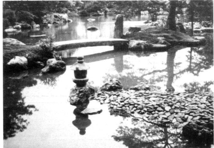
A gauche: Fig. 4: Jardin particulier du palais impérial de Shugakuin, 17 e siècle, Kyoto.