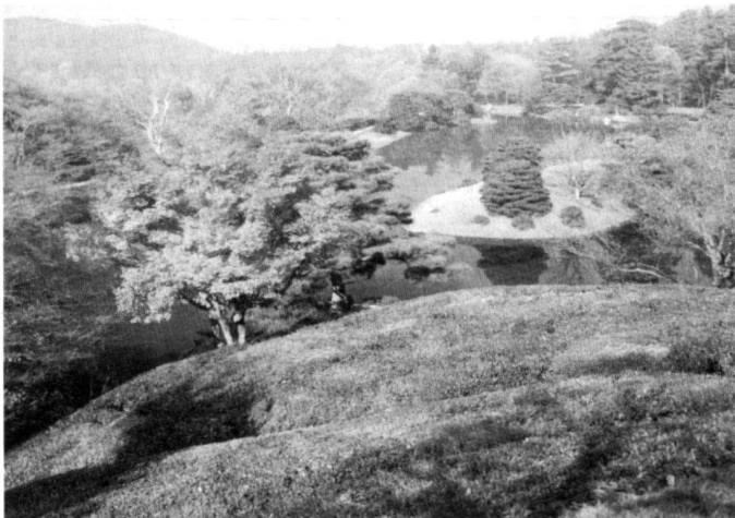
Links: Abb. 4: Villagarten des Kaiserpalastes Shugakuin, 17. Jahrhundert, Kyoto.

Saku (Saku = Bau) -Tei (Tei = Garten) -Ki (Ki = Schreiben) ist eine von dem Edelmann Tachibana-no-Toshitsu im 11. Jahrhundert verfasste Anleitung für den Bau von Gärten, auch von Teichgärten, die in Anlehnung an das Meer und die Küstenlandschaft konzipiert wurden. Das Werk enthält nicht nur landschaftsgestalterische Hinweise, sondern beschreibt auch das damit verbundene Gedankengut und die spezielle Atmosphäre, die es bei der Gestaltung einzufangen und umzusetzen gilt.