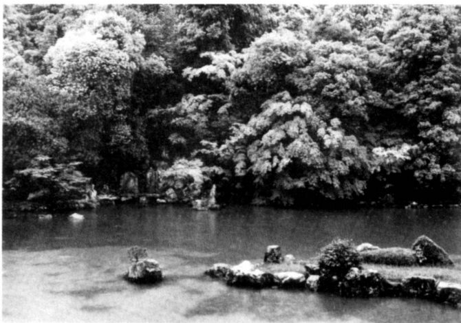
Links: Abb. 2: Der Teichgarten des Tenryu-Ji-Tempels, einer der ersten Gärten des Zen-Buddhismus, 14. Jahrhundert, Kyoto.