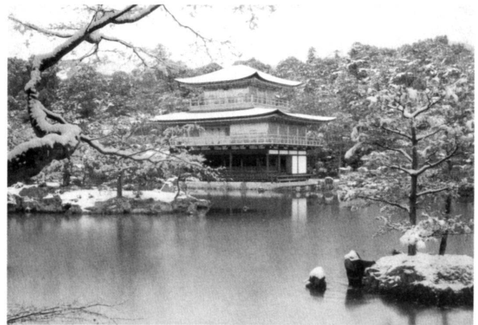
Left: Fig. 2: Pond garden of Tenryu-Ji temple, an origin of Zen sect Buddhism garden, 14th century, Kyoto.