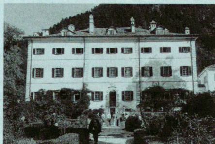
Gartenfront des Palazzo von Salis in Bondo/Bergell.

Und schliesslich – ein Geheimtip übrigens für alle, die das Grossartige nicht nur in der Ferne zu suchen pflegen – die Villa Vertemate in Piuro