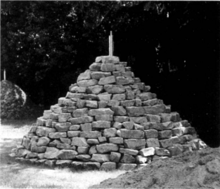
Idee – Erstellung – Benutzung.