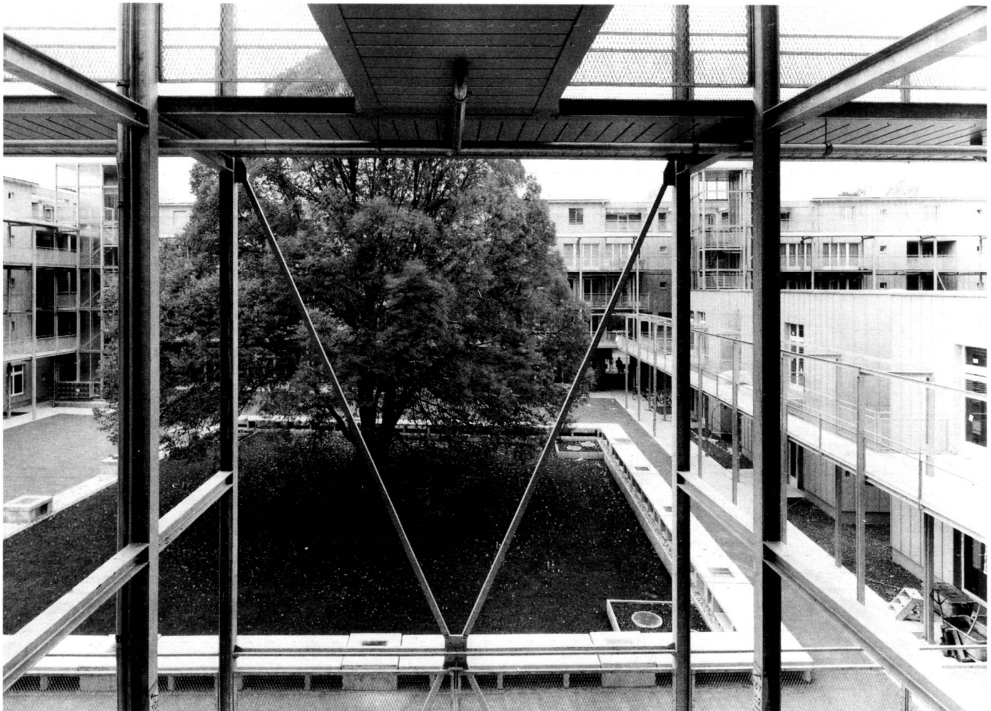
Die Linde – das Wahrzeichen des Brahmschhofes.

A second feature of the surrounding grounds is the co-design and utilisation of