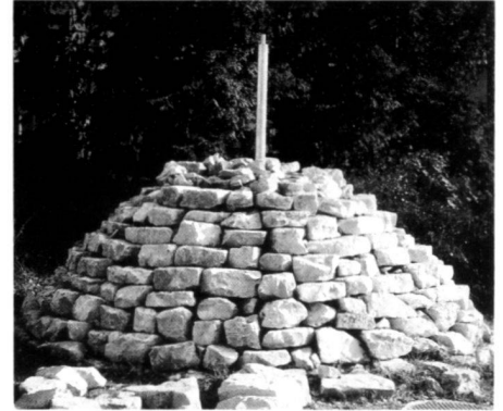
Idea – construction – use.

denn auch, die mit einem aus dem Umgebungsbudget freigestellten Betrag die weitere Möblierung und Ausstattung weitgehend selber bestimmte. Federballnetz, Basketballkorb, Feuerstelle und mobile Bank sind einige Errungenschaften; Spielbretter und -seile werden folgen. Ein zweiter wichtiger Bereich, wo die Bewohnergruppe aktiv mitgestaltete, ist die auf der Ostseite liegende Freifläche. An verschiedenen Sitzungen kristallisierte sich allmählich heraus, dass die Bewohner keinen fertig gestalteten Garten wünschten, in dem Gestalt und Art der Nutzungen bereits festgelegt sind. Einzige Ausnahme bildete der gemeinsame Nutzgarten. Der Planer stand nun vor dem Dilemma, nichts zu gestalten und doch etwas vorzuschlagen.