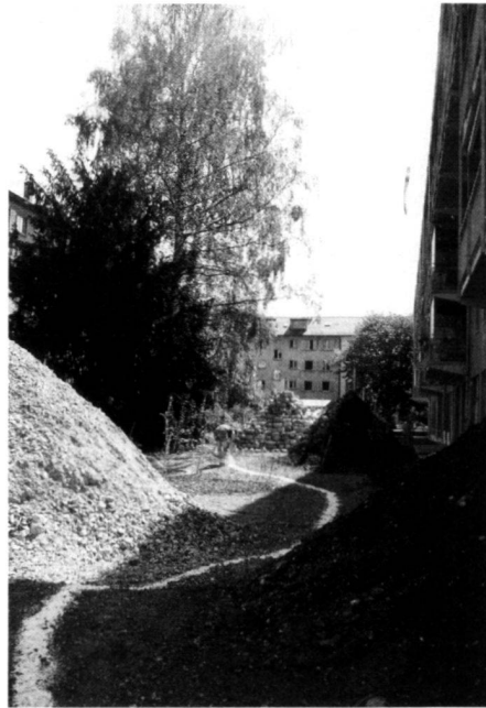
Idee – établissement – utilisation.