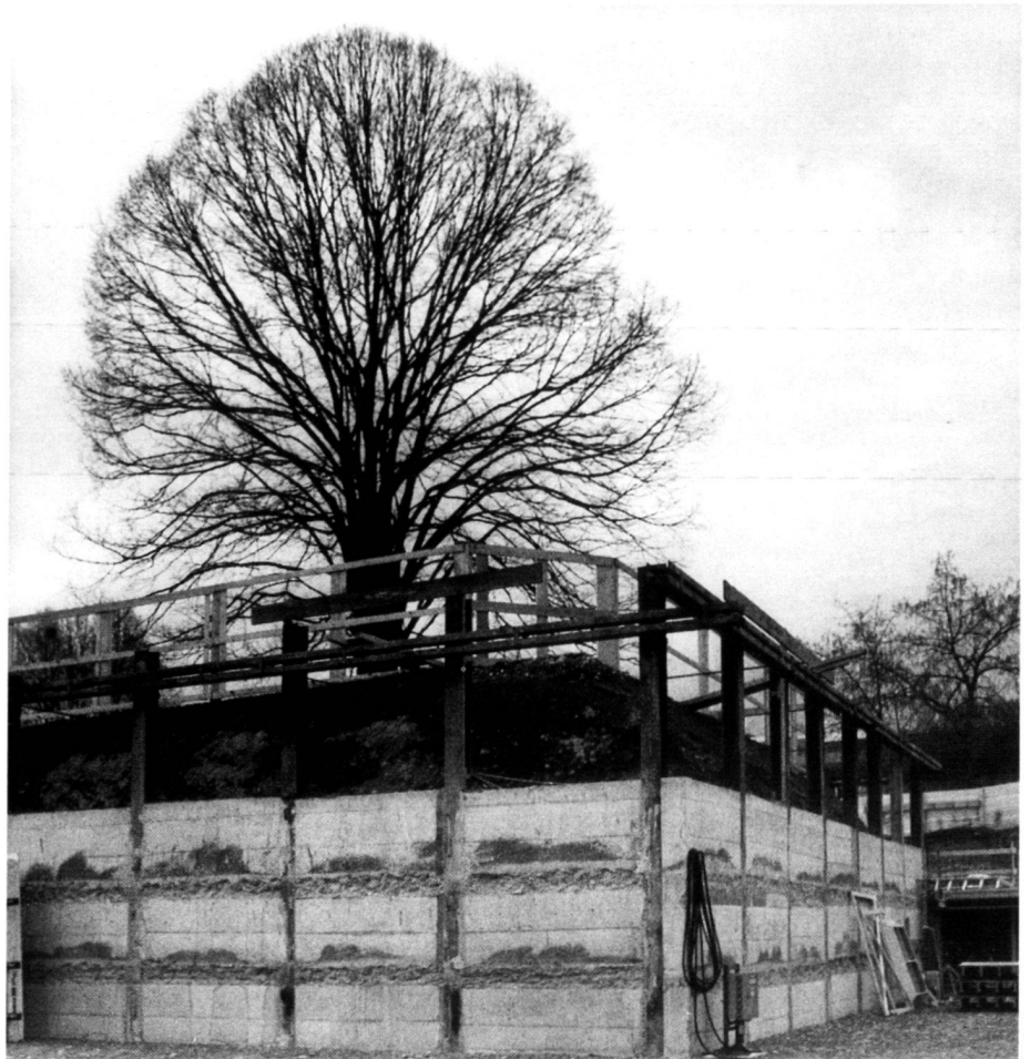
Der «Baumtopf» in der Baumgrube. L'ensemble des racines dans la fosse de l'arbre. The "tree pot" in the tree pit.