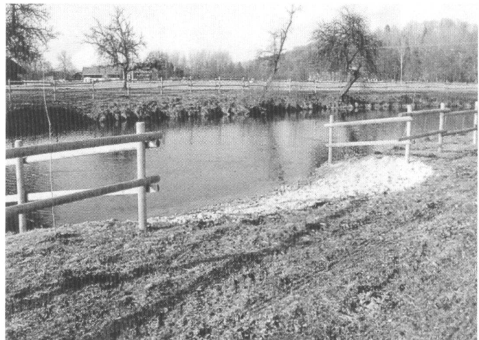
Protection des eaux stagnantes contre l'invasion des prés (à gauche).