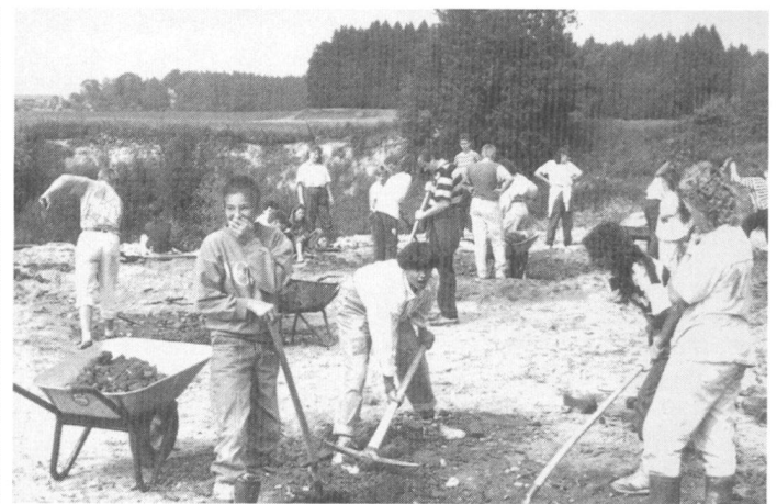
Agriculteurs et habitants de la commune plantent des arbustes (à gauche).