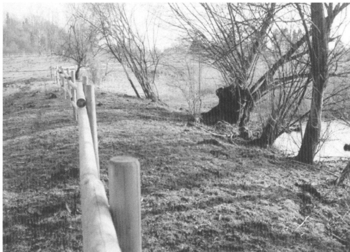
Schutz der Altwässer vor Beweidung (links).

In the medium term, the objective of all parties involved is to get away from state subsidies in order to return to reasonable prices for agricultural products from an intact landscape under the motto "Pre-