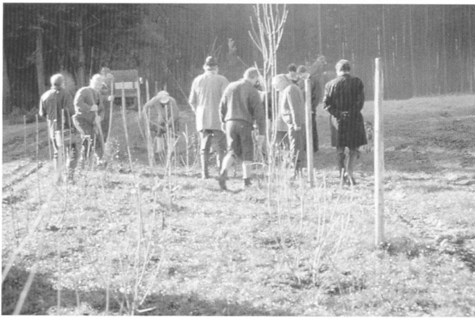
Landwirte und Gemeindebürger pflanzen Feldgehölze (links).