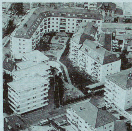
Apollo-Center in Brig. Die Dachgartenfläche zwischen den Bauten ist im Sarnafil-Flachdachsystem mit Sarnavert-Begrünungssystem erstellt.