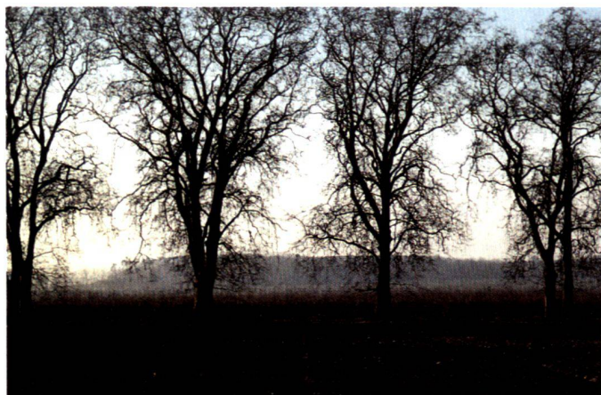
Potsdamer Landschaft: Um 1850 wurde von Lenné die Bornimer Feldflur «aufgeschmückt». Noch heute durchziehen mächtige, z. T. aber ruinierte Alleen die Landschaft.