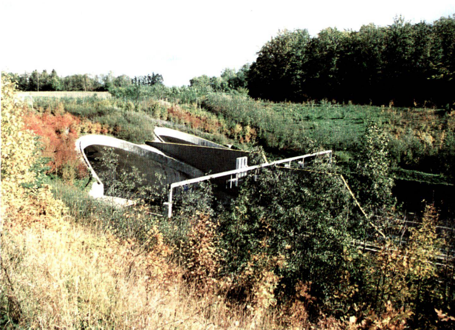
In einigen Jahren werden die Tunnelportale hinter einer dichten Gehölzpflanzung verschwinden.