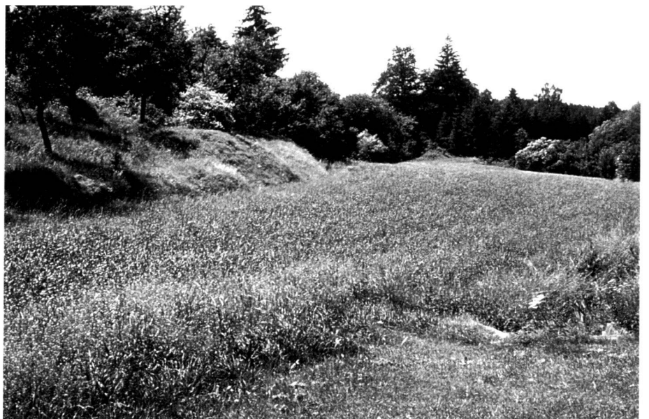
Dry valley in muschelkalk.