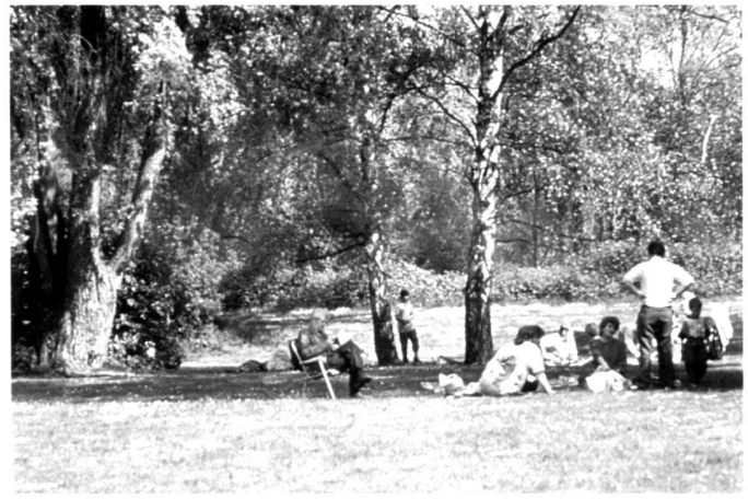
A gauche: Cirque de vignobles sur le cours septentrional du Neckar. A droite: Le lac Max-Eyth dans la vallée du Neckar.