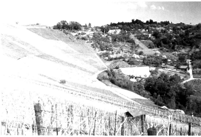
Links: Arena der Weinberge im nördlichen Verlauf des Neckar. Rechts: Im Neckartal. Max-Eyth-See.