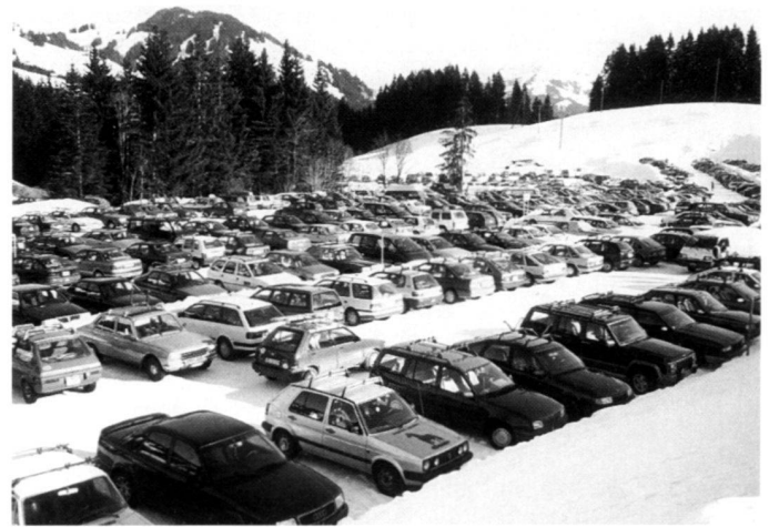
Les masses de gens et de voitures dans les espaces récréatifs ou dans le paysage hivernal enneigé ont sensibilisé la population.