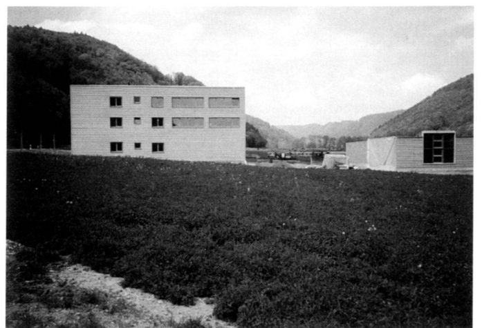
Construction outline struts instead of fruit trees on the village outskirts, commercial structures in the familiar meadowed valley influence referenda, but not actions yet.