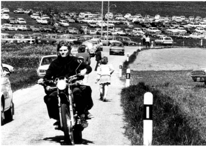
Erlebnisse wie die Massierung von Menschen und Autos im Naherholungsgebiet oder in verschneiter Winterlandschaft haben die Bevölkerung sensibilisiert.