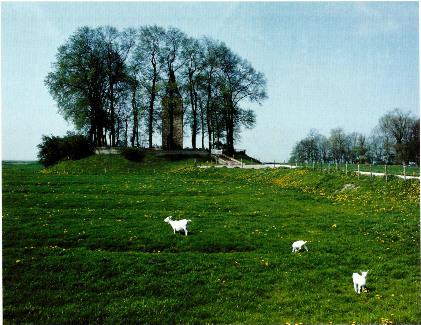
Friedhof Oosterwierum in Westfriesland. «Terpen», künstliche Hügel über der Flutwassergrenze.