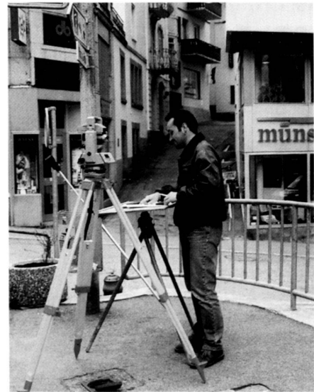
Geländeaufnahme mit dem digitalen Theodolit, Studienprojekt 6. Semester.

Se fondant sur un projet dessiné et visualisé par ordinateur pour la Via Maistra de St. Moritz, une rue à circulation ralentie, il s'agissait d'étudier dans quelle me-